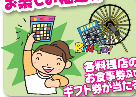
各料理店のお食事券及び ギフト券が当たる