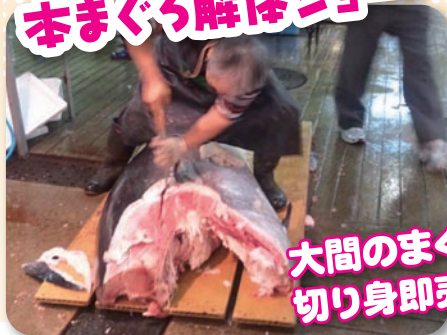
大間のまぐろ 切り身即売!